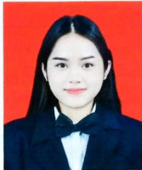
Gambar 1. Foto dengan background warna merah